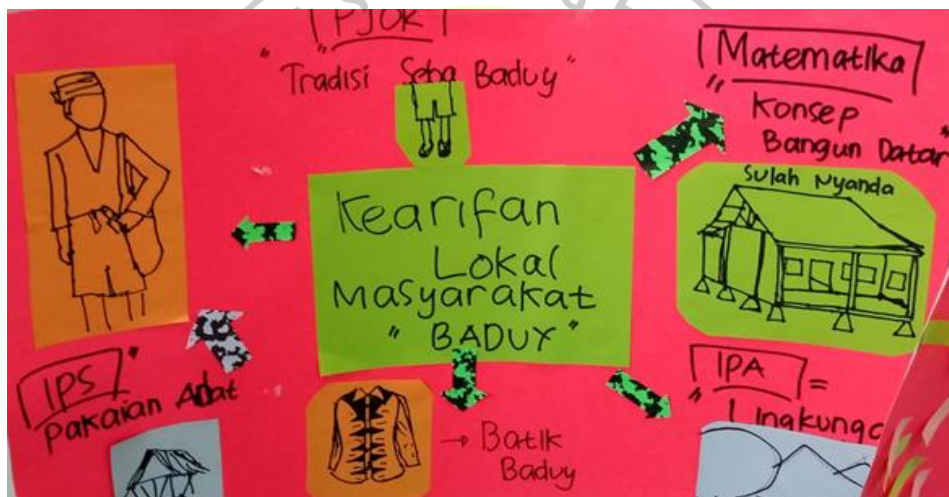
Gambar 2. Konsep Matematika, PJOK, IPS, dan IPA pada Budaya Baduy

Salah satu ciri pendekatan CRTT yaitu memperhatikan latar belakang budaya yang dapat menstimulasi munculnya kesadaran identitas budaya. Gambar 2 dan 3 merupakan poster yang dibuat oleh guru, dalam poster tersebut guru mengembangkan kreativitasnya dan mengintegrasikan budaya ke dalam pelajaran, yaitu matematika dalam konsep bangun datar, PJOK dalam konsep tradisi suku Baduy, IPS dalam konsep pakaian adat, dan IPA dalam konsep lingkungan.