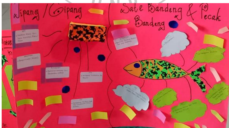
Gambar 3. Keterkaitan konsep dengan Gipang dan Sate Bandeng