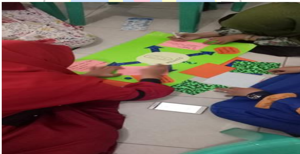
Gambar 5. Guru bekerja sama dalam mengintegrasikan ide

Workshop ini mendorong guru antar mata pelajaran untuk bekerja secara berkelompok yang berdampak terhadap kemampuan mengintegrasikan pemikiran berbeda dari setiap guru mata pelajaran.