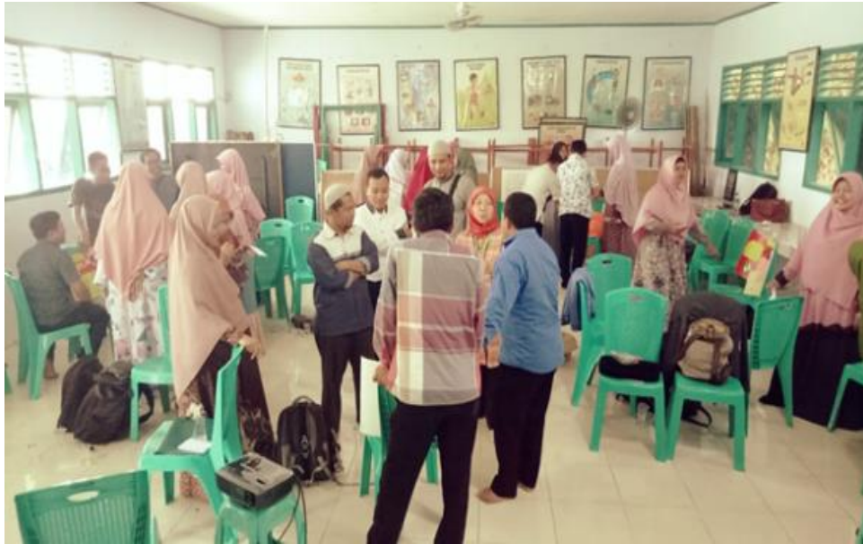
Gambar 6. Guru saling mencari tahu hasil kerja setiap kelompok

guru antusias karena variasi penggunaan metode yang disesuaikan dengan karakteristik peserta didik, serta kaitannya dengan budaya peserta didik. Workshop yang dilaksanakan membantu guru dalam menciptakan pembelajaran yang bermakna, guru merupakan Facilitating of Content Knowledge yang membantu peserta didik untuk mendapatkan pembelajaran berdasarkan apa yang dibutuhkan (Hernandez, C.M., Morales, A.R. & Shroyer, M.G., 2013).