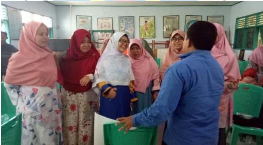
Gambar 4. Guru bertanya terkait konsep dan budaya

Guru dapat mengembangkan berpikir kritisnya melalui proses pencarian perbedaan perspektif budaya yang dapat menantang pengetahuan (Rahmawati, Y., & Ridwan, A., 2019). Tahap ini dalam CRTT sejalan dengan prinsip dari Social Justice , dimana guru didorong untuk bertanya dan ditantang untuk lebih kritis (Hernandez, C.M., Morales, A.R. & Shroyer, M.G., 2013). Pada workshop ini, guru dituntut aktif untuk berpikir secara kritis mengenai budaya serta konsep yang akan diajarkan.